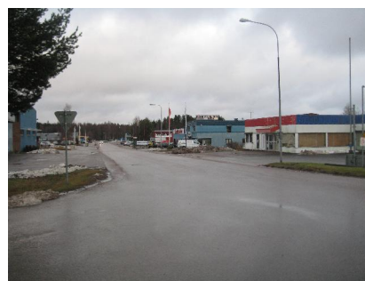
Industrigatan, sett från Jordbrovägen

Fastigheterna Ed 1:34 och 1:217 med angränsande natur- och parkmark omfattas av tertiär skyddszon för vattentäkt. Särskilda skyddsföreskrifter gäller.