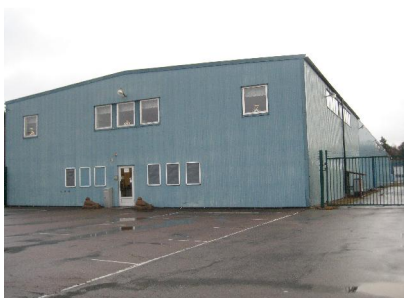
Exempel på byggnader i området