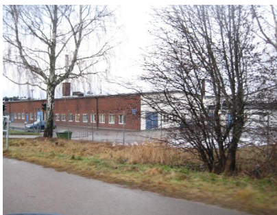
Purtech (Kårslätt 1:41)

En fast fornlämning finns registrerad inom planområdet, en milsten vid Jordbrovägens östra del. Fasta fornlämningar omfattas av skydd enligt Kulturminneslagen och får inte tas bort, ändras eller skadas. Skyddet säkerställs med planbestämmelse.