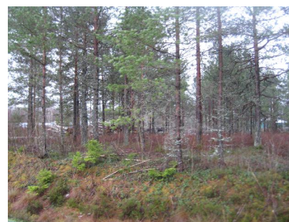
Obebyggd mark vid norra delen av Industrigatan

I utredningen föreslås för södra delen av Ullerön 1:30 att den torv som finns schaktas bort och att återfyllnad sker med friktionsmaterial som packas. Lättare bebyggelse bedöms kunna läggas på fyllningen, medan tyngre byggnader kräver grundförstärkning med pålar. Även för torvområdet på Kårslätt 1:32 väster om f.d. järnvägsspåren/nuvarande Mejselvägen, föreslås att torven schaktas bort för byggnader, körbanor och under va-ledningar, och återfylls